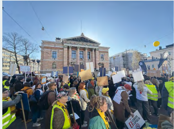
Kuuloliitto osallistui sote-järjestöjen yhteiseen mielenosoitukseen kehysriihen alkaessa 21.4.

Suomen ratifioima YK:n vammaissopimus velvoittaa valtioita ottamaan vammaiset ihmiset