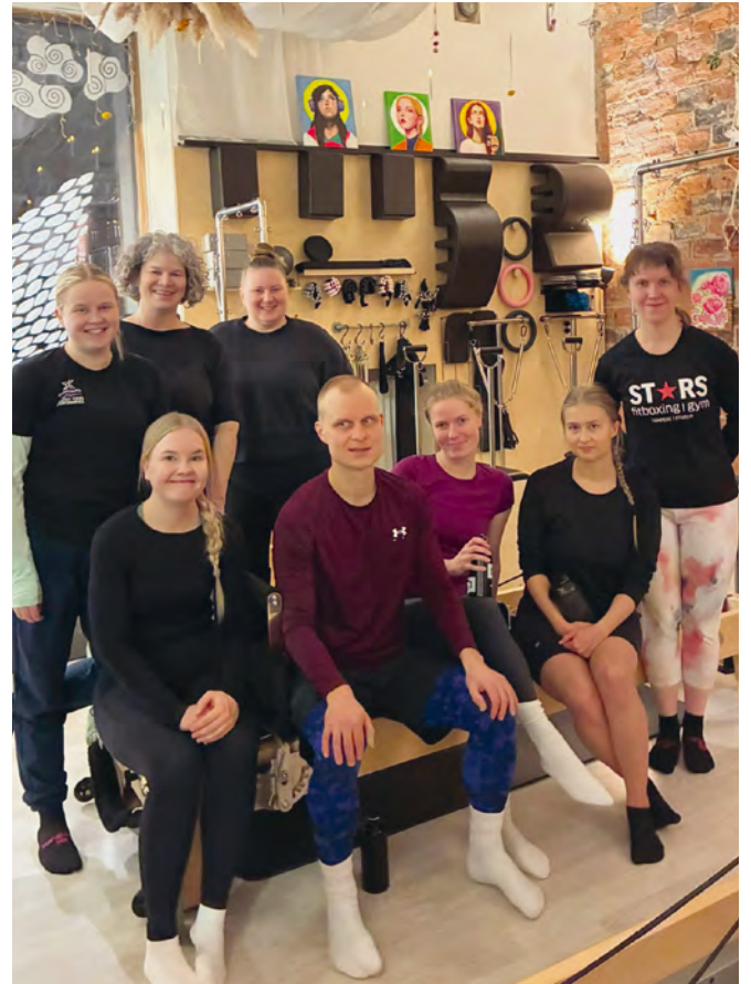
Kuva laitepilateksesta Choose Joyn studiolta Tampereelta 11.2.2026.

Liikunta tukee kaikkien hyvinvointia, myös kuulovammaisten, sillä se vahvistaa terveyttä, jaksamista ja osallisuutta. Suomi liikkeelle -hanke tarjoaa matalan kynnyksen mahdollisuuksia kokeilla erilaisia liikuntamuotoja ja löytää itselle sopiva tapa liikkua. Aiempaa osaamista lajeista ei tarvita ja tapahtumat ovat lähtökohtaisesti ilmaisia tai edullisia. Toimintaan ovat tervetulleita kaikki kiinnostuneet, ja mukaan lähteminen on helppoa ja kannustavaa, tärkeintä on rohkeus kokeilla ja tulla mukaan. Voit myös ottaa yhteyttä hankekoordinaattoriin ja ehdottaa paikkakunnallesi liikuntakokeilua. Tähän mennessä on kokeiltu muun muassa keilausta, padelia, petankkia, ilmajoogaa ja hyroxia, ja tulevaisuudessa suunnitelmissa on esimerkiksi melontaa, rantalentopalloa ja jousiammuntaa.