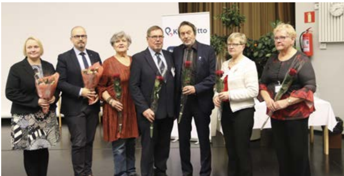
Yhteiskuvassa liittohallitus 2024 - 2026.

Liittokokous päätti, että liiton puheenjohtajalle maksetaan palkkiota 1000 euroa/kk ja varapuheenjohtajalle 500 euroa/kk. Vuodesta 2024 lähtien hallituksen puheenjoh-