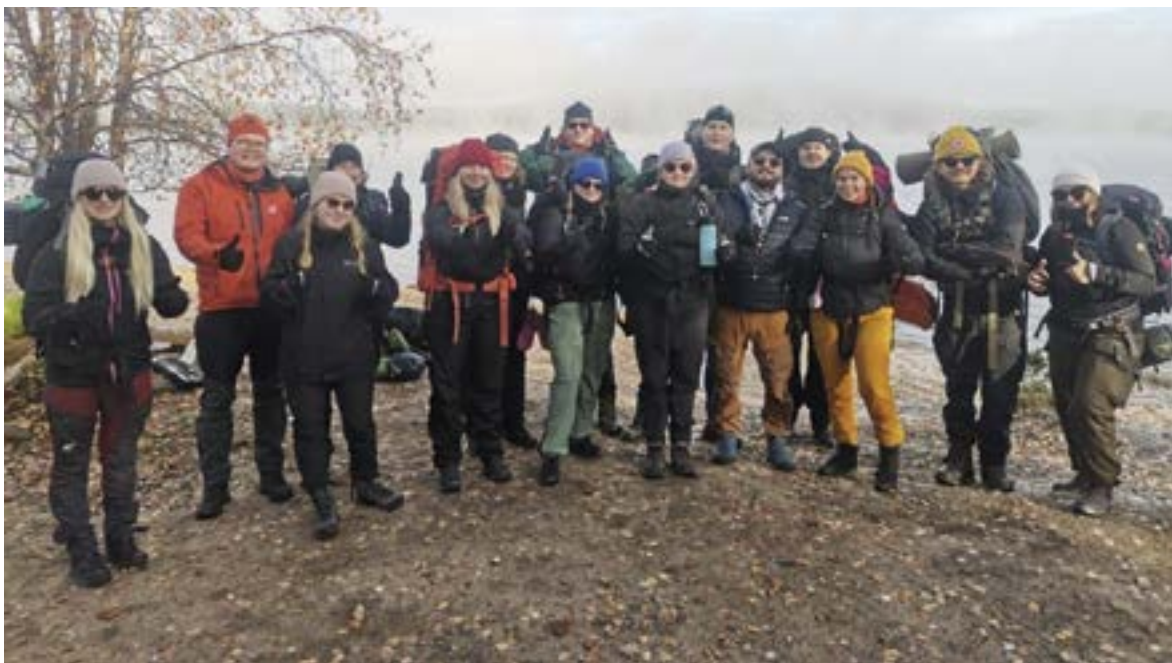
Ryhmäkuva. Kuva: Maria Timonen)

Vaeltaminen jatkui vastoinkäymisistä huolimatta ja jokainen meni omaa tahtiaan, ei kuitenkaan kukaan jäänyt yksin. Toisen päivän vaellusta hankaloitti vaikea maasto, ja totta kai erään vaeltajan, Juhon, toinen kengänpohja irtosi myös. Etujoukolla oli nopeampi tahti ja he pääsivät Montellin majalle. Me häntäjoukot taas jäimme sitä