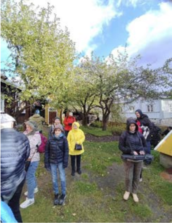
CI-viikonlopun osallistujat tutustumassa vanhaan Raumaan sekä kirjoitustulkki työssään