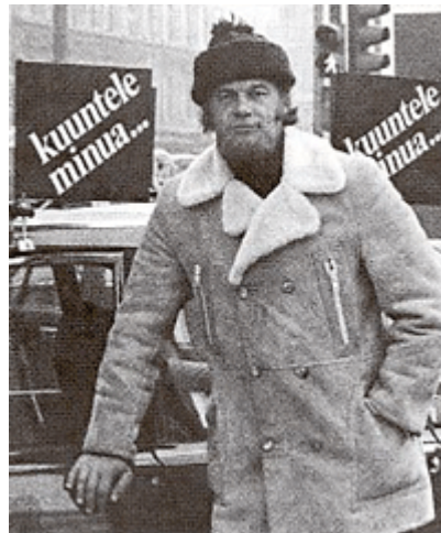
1970-luvun jälkipuoliskolla Spede Pasanen toimi Tietoa kuulosta -kampanjan suojelijana.

Vuosikymmenen aikana liitosta oli muodostunut vahva yhteiskunnallinen vaikuttaja. Liiton ensimmäinen yhteiskunnallinen ohjelma valmistui.