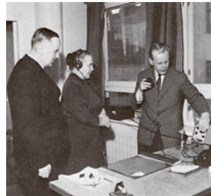
Sosiaaliministeri Vieno Simonen tutustumassa puheenharjoituslaitteeseen vuonna 1960.

Kuulokeskuksessa aloitti työnsä kuulonopettaja ja teknisessä laboratoriossa kuulokojemekaanikko.