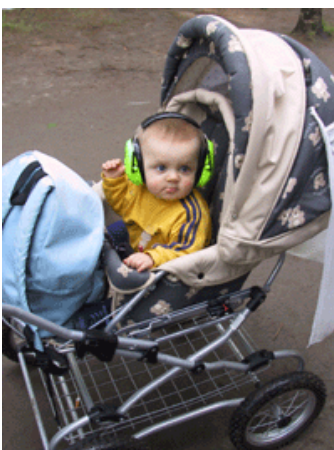
Sitkeä kuulonsuojauskampanjointi alkoi tuottaa tulosta 2000-luvun puolella.