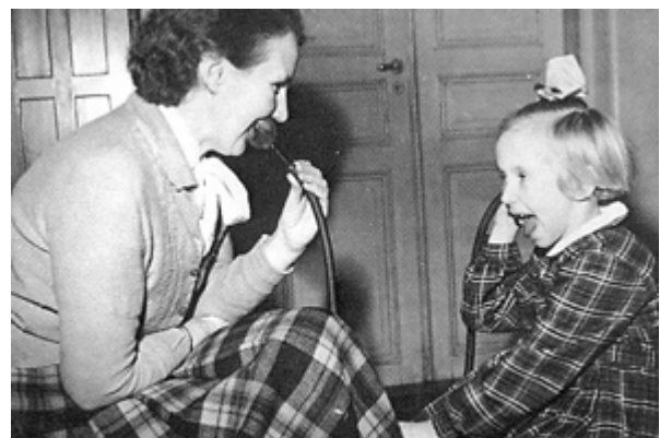
Liiton ensimmäinen äiti-lapsi-kurssi järjestettiin Turussa 1952.