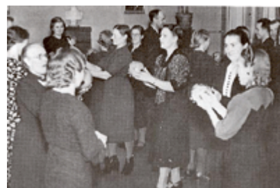
Myötäkuulokurssin rytmiharjoitus syksyllä 1941.