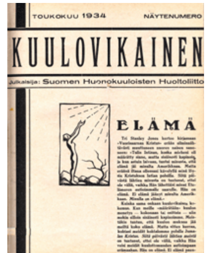
Kuulovikainen-lehden ensimmäinen näyttenumero vuodelta 1934.