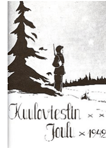
Kuuloviestin joululehden kansi sota-aikana.

Suomen Huonokuuloisten Huoltoliiton nimi vaihtui Kuulonhuoltoliitoksi. Helsingin yliopistollisen keskussairaalan kuulolaitepoliklinikka lakkautettiin ja liiton Kuulokeskus aloitti toimintansa. Keskukseen